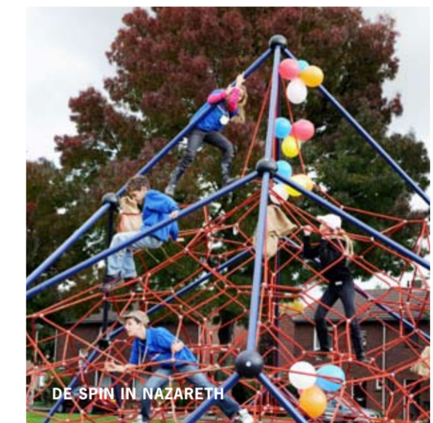
DE SPIN IN NAZARETH

Jongeren in Wyckerpoort hebben de handen ineens geslagen en hebben na overleg met omwonenden het voor elkaar gekregen dat er binnenkort een schuilplek op het Old Hickoryplein wordt geplaatst. Begin oktober is in Limmel een SPOT (Sportontmoetingsterrein) geopend. Dit inspireerde de jongeren van Wyckerpoort. Ook daar wordt nu aan een dergelijk idee gewerkt. In Nazareth werd in oktober op initiatief van de kinderen zelf een Spin geopend. In Wittevrouwenveld knappen jongeren naar eigen idee hun ruimte in het Trefcentrum op. Verder is er een Kidsbus op de weg. Vanuit de bus worden kinderen en jongeren geïnspireerd om mee te doen.