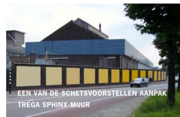
EEN VAN DE SCHETSVOORSTELLEN AANPAK TREGA SPHINX-MUUR

Rondom de Coronafat wordt het groen aangepakt. Het zal een meer parkachtige uitstraling krijgen. De plannen zijn met een werkgroep besproken en goedgekeurd. Het zal dan ook niet meer lang duren voordat met de uitvoering wordt gestart. De buurt heeft voorgesteld om het groen van de Baljeweg te versterken. De gemeente en Servatius bekijken nu in hoeverre die voorstellen passen binnen de ontwikkelingen van de buurt. Een definitief besluit wordt na de vier buurtbijeenkomsten in november genomen.