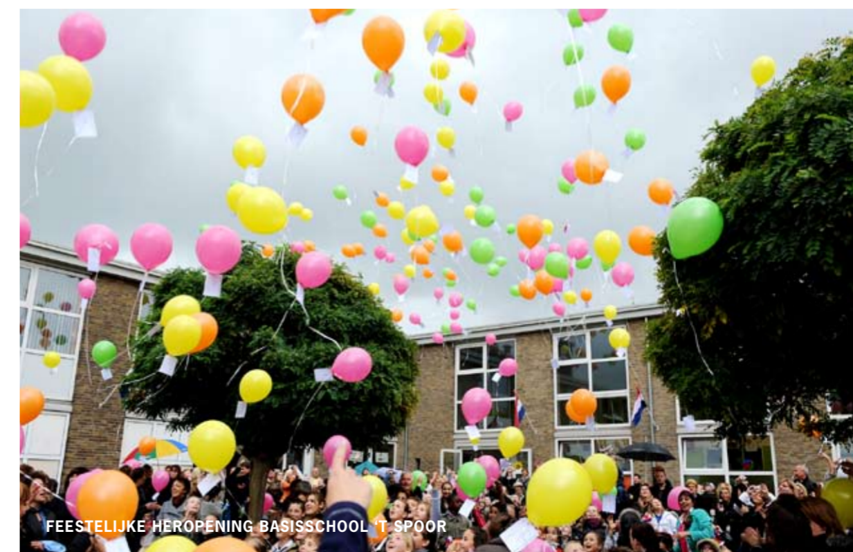
FEESTELIJKE HEROPENING BASISCHOOL 'T SPOOR