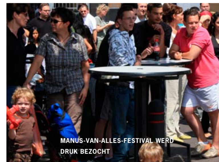
MANUS-VAN-ALLES-FESTIVAL WERD DRUK BEZOCHT

Wanneer? ma.t/m do. van 9 tot 12.30 en daarnaast op afspraak Bereikbaar? (043) 362 69 25 Email? paul.zeegers@wnbmaastricht.nl