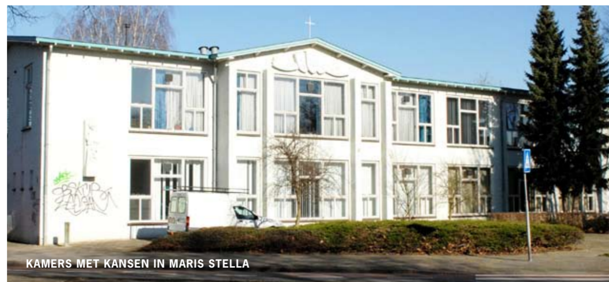
KAMERS MET KANSEN IN MARIS STELLA

Voor de periode na 2010 worden de wijkontwikkelingsplannen (WOP's) maatgevend. Een WOP voor Limmel/Nazareth en een WOP voor Wittevrouwenveld/Wyckerpoort. Het eerste concept van de WOP's wordt gepresenteerd en bediscussieerd op 24, 25, 26 en 27 november. Aansluitend kunt u nog tot 16 januari 2009 per mail of per post reageren. In november 2009 worden de definitieve WOP's vastgesteld in de gemeenteraad.