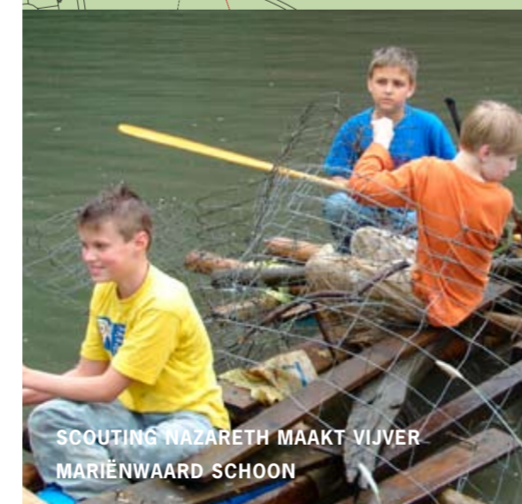
SCOUTING NAZARETH MAAKT VIJVER MARIËNWAARD SCHOOL