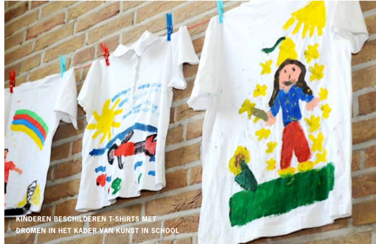
KINDEREN BESCHILDEREN T-SHIRTS MET DROMEN IN HET KADER VAN KUNST IN SCHOOL

De woningen in de Frankenstraat, waarvan er een aantal boven de winkels liggen, zijn zeer geschikt voor starters en jonge gezinnen. Nu wonen er vooral studenten. Servatius wil een betere woonmix, zodat het in de Frankenstraat prettig wonen wordt. De bereikbaarheid van de straat verdient ook aandacht, er komen goede parkeermogelijkheden. Tenslotte zijn communicatie en promotie belangrijk; de bezoeker moet weten hoe aantrekkelijk de Frankenstraat is.