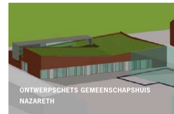
ONTWERPSCHETS GEMEENSCHAPSHUIS NAZARETH