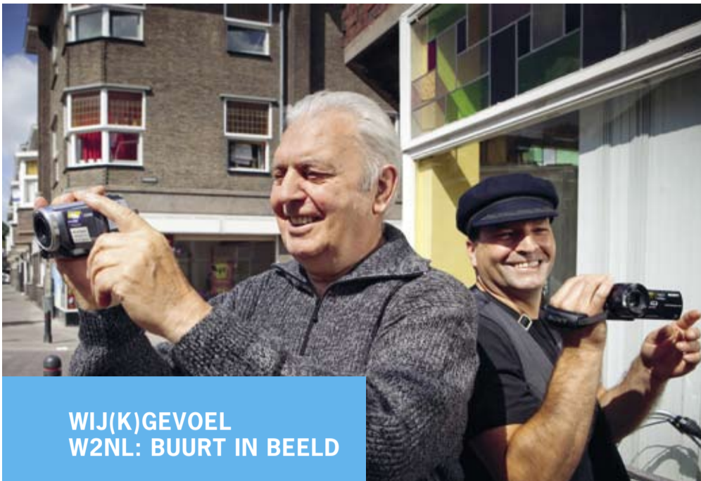
WIJ(K)GEOVEL W2NL: BUURT IN BEELD