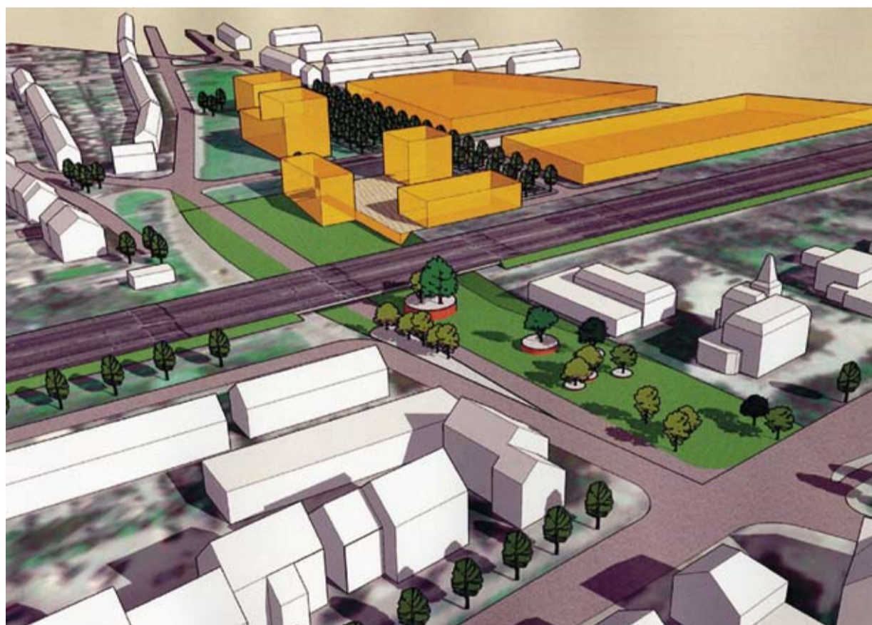
Voorbeeld van schets Hoolhoes locatie