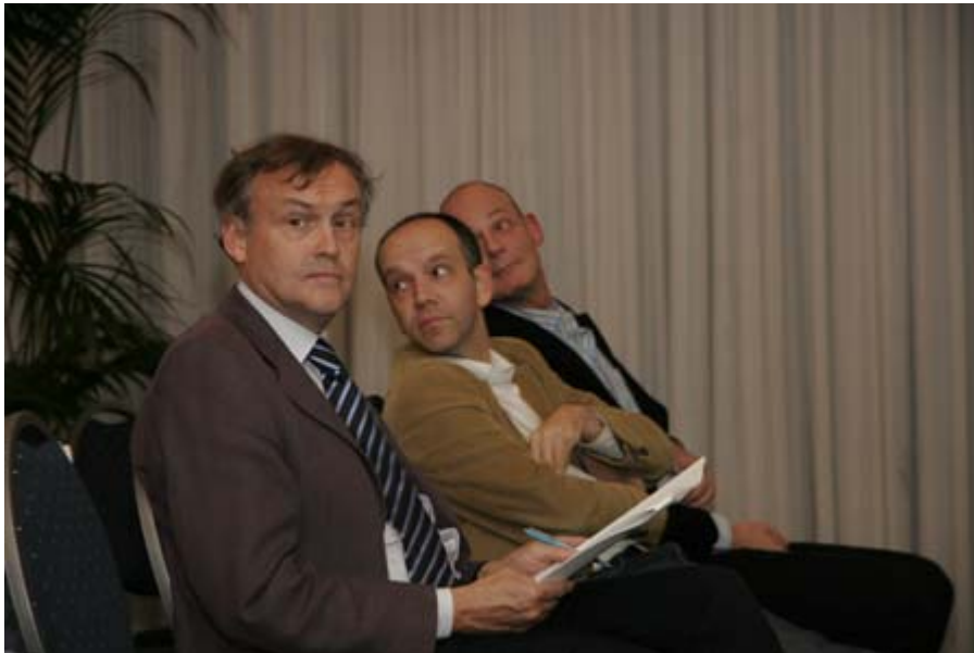
wethouder en projectleider kijken achterom én naar voren, Den Haag kijkt mee...

Dit leidt tot de conclusie dat men zich in in het algemeen kan vinden in zowel de gegeven beschrijving en analyse van de wijk als de speerpunten en actiepunten. Wel zijn er vraagpunten, kanttekeningen en suggesties die vervolgens zijn verwoord in de verslagen. Ook de vastgestelde prioriteitsvolgorde van de speerpunten wordt als uitgangspunt in ruime mate gedragen